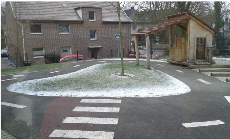
(Tankstelle NIDO-Kindergarten Dortmund)